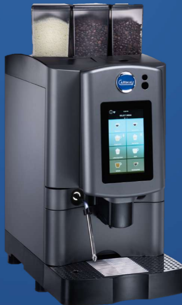
Armonia Soft Plus