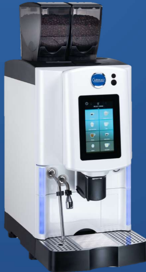
Optima Soft Plus