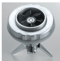
Vulcanized rubber gears