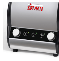
Orione Timer VV