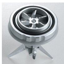
Metal gears on request