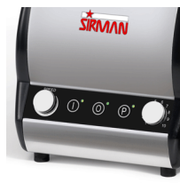
Orione Plus VV