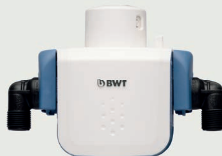
BWT BESTHEAD FLEX FILTER HEAD ГОЛОВНАЯ ЧАСТЬ ФИЛЬТРА